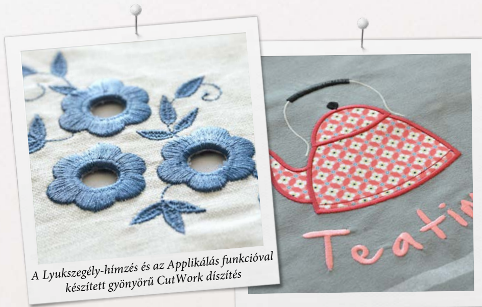
A Lyukszegély-hímzés és az Applikálás funkcióval készített gyönyörű CutWork díszítés

A BERNINA DesignerPlus csomag egy pendrive-ot és egy, a hardverkulcsot helyettesítő termékaktiváló kártyát tartalmaz. A szoftvert a pendrive-ról telepítheti, aktiválásához pedig a kártyán található aktiváló kódra lesz szüksége. A szoftver telepítésére, frissítésére, illetve a régebbi verziók frissítésére vonatkozó információkért keresse fel BERNINA márkakereskedését vagy látogassa meg a bernina.com/V8 weboldalt.