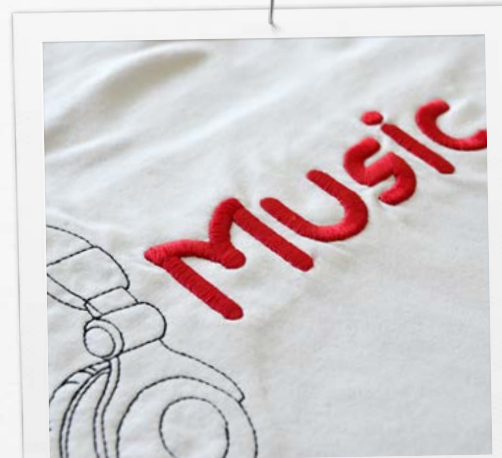
A Pufi betűk funkcióval nagyszerű térhatású feliratokat készíthet

A szoftver minden funkciója hihetetlenül könnyen kezelhető az új felhasználóbarát interfésznek köszönhetően. A Mintaelhelyezés funkcióval a hímzéseket gyorsan és pontosan helyezheti el, a Többszöri keretbe foglalás funkció pedig a mintákat automatikusan több részre osztja fel, így a nagyobb hímzéseket is zökkenőmentesen készítheti el. A Színkezelőben a megszámozott színeket pillanatok alatt kikeresheti, az Automatizált mintarendezés quilt-négyzetekre funkció segítségével a foltvarrással készült darabokra is precízen hímezhet. A BERNINA DesignerPlus szoftverrel bármit elkészíthet, amit csak el tud képzelni. Akár művészi díszítéseket szeretne készíteni, akár feliratokat, alakzatokat, szabad kézzel rajzolt mintákat vagy bittérképeket multimédiás projektekhez, a szoftver segítségével mindezt megteheti. Az Automata digitalizáló eszközzel különböző fájlokat egyetlen kattintással hímzőmintákká alakíthat, majd az Előnézet funkcióval megnézheti, hogyan mutatnának különböző típusú anyagokon. Hímezni még sosem volt ilyen egyszerű és élvezetes